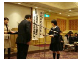
学校保健研究集会で表彰