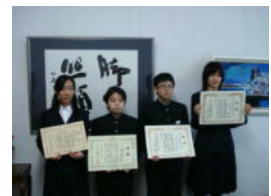
税についての作文表彰