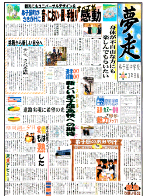
中学校かべ新聞大賞 弟子屈町立弟子屈中学校3年B組

上位入賞作品は北海道新聞でも紹介されましたが、カラー制作も可とされていることから、明星祭壁新聞コンクールでは「カラー不可」となっている本校の作品は、大変不利な状況を突き破って入選したことになります。それだけ記事の内容が高く評価されたものと思います。約一カ月の期間、合唱練習に取り組みながら、壁新聞に取り組む本校の明星祭のスタイルは、少なくとも20年以上続けられてきた伝統です。模造紙大