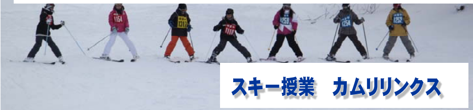
スキー授業 カムリリンクス

1/18（金）と25（金）、1・2年生を対象にしたスキー授業。一日目は厳寒の中、二日目は時折吹雪で視界不良の中、16人のインストラクターから指導を受け、たった2回で大きな進歩を見せた生徒が多かったようです。平均11人に分かれた班単位で、カビンギスキーの特性を生かしたスキ板への乗り方や、一斉にスタートして扇形やハート形の隊形を取りながら滑り降りる高度なフォーメーションにも挑戦しました。