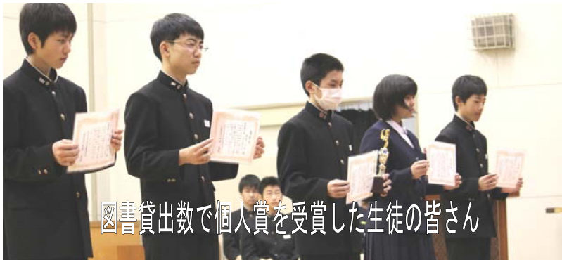
図書貸出数で個人賞を受賞した生徒の皆さん