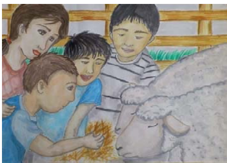
北海道知事賞（最優秀賞） 尾中 謙吾君（2-3）

講評；家族一人一人の表情に優しさ、温かさが感じられ、楽しかった思い出の様子が伝わってきます。画面いっぱいに描かれた母と子ども達、羊。大切なところを強調した構成がとても良く、また、水彩らしい透明感のある色調が美しい作品です。