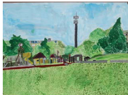
日谷 優太君 (1-3)