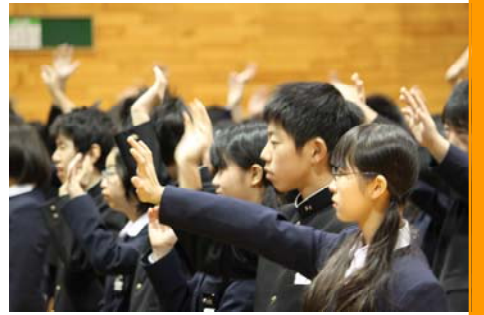
↑ ○×クイズに取り組む全校生徒

11月26日(月)1校時、体育館にて「ユニセフハンドインハンド集会」が行われました。この全校集会でも、生徒会本部役員が見事な企画・運営ぶりを発揮してくれました。「ユニセフとは?募金の行方は?何に使われるのか?」等、活動の趣旨が理解できるよう、工夫されたプレゼンが準備されました。なかでも、Q&A方式で解説された「アンサー」は、1年生の本部役員4名が、原稿なしで行い、会場が驚きに包まれました。本校では、平成3年から行われている伝統行事の一つです。毎年毎年、リレーされて今日に至っているのです。買い物公園で、募金活動をしていると、「私も明星の卒業生です。」とか「明星中の時、ハンドインハンド、やりました。」「頑張ってください」と初対面の人に言われることが少なくありません。今年、自らボランティアに志願した1・2年生は158人。24人の先生方と一緒に、13時頃から14時頃まで、宮下通から3条通にかけて、大きな声を響かせます。