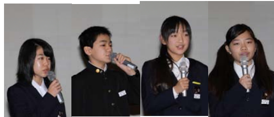
← わかりやすくそして正しく解説する1年生本部役員