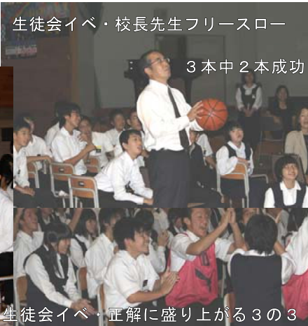
生徒会イベ・校長先生フリースロー