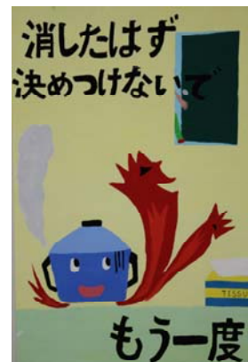
佳作 2年 南條 聖花