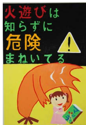
佳作 2年 木下 美咲