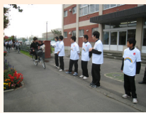
ピア・サポート (あいさつ運動)

「CWN」とは校訓「知と和と粘り」の頭文字を取ったものです。10月21日(水)・22日(木)の2日間、総合的な学習の時間「CWN講座」の発表会が行われました。今年は9講座が開設され、その学習の成果が披露されました。インフルエンザの影響が若干あり、準備時間が十分でなかったり、当日欠席があったりで満足な発表ができない講座もあったようですが、発表のところで個性を見つけることができました。この学習をきっかけにさらに色々なことに興味を持って取り組み個性を磨いていってほしいと思います。