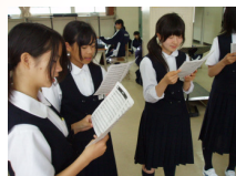
ハモりん♪ (練習風景)