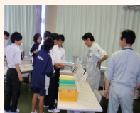
Let's ボランティア (分別の学習)